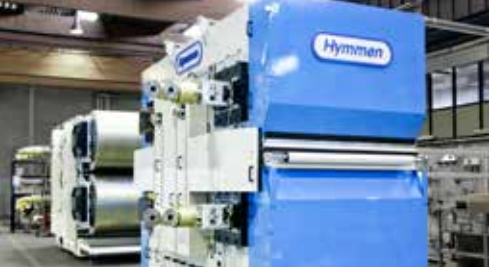
Double Belt Presses