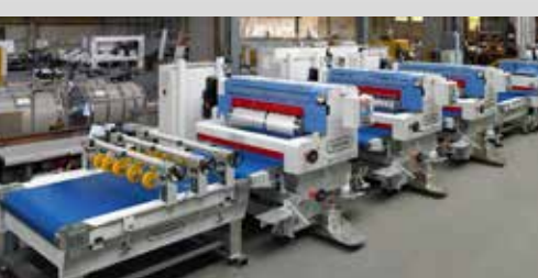
Lacquering and Direct Printing Lines