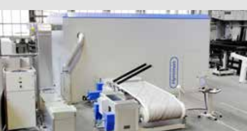
Industrial Digital Printing Lines